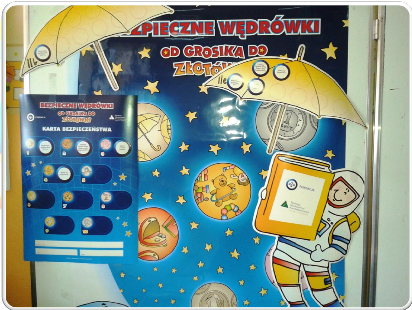
Bezpieczne wędrówki OD GROSIKA DO ZŁOTÓWKI 2014/2015