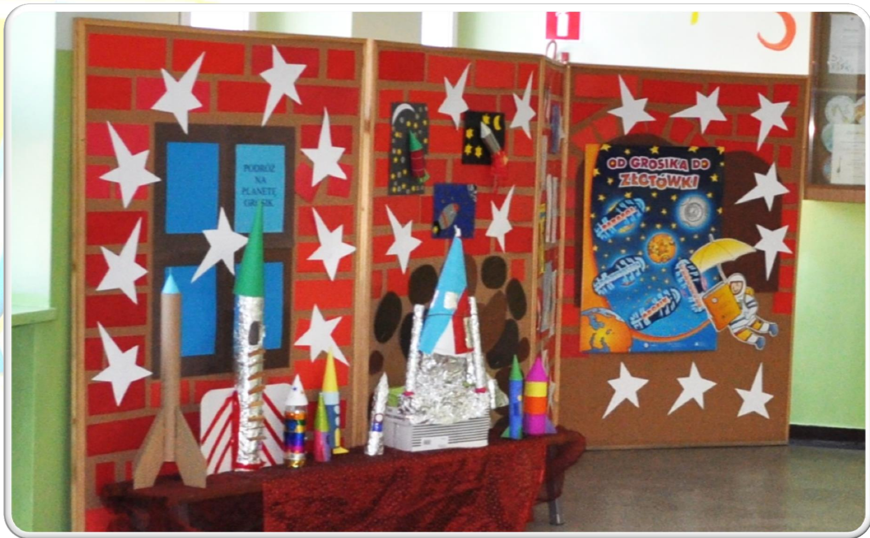
Wystawa naszych rakiet